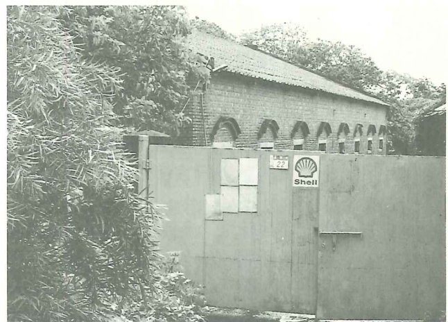
十數年來，殼牌倉庫少有開放為淡水人所知的機會

為做好殼牌倉庫之古蹟維護及空間規劃工作，淡水文化基金會已成立一環境整理維護小組，並邀請淡水文化團隊及學者專家共同組成「殼牌倉庫空間規劃委員會」，計劃一面進行環境景觀的整理維護，一面展開殼牌倉庫之史蹟調查研