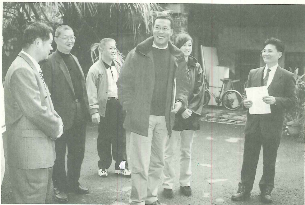
2000年的最後一天，台灣殼牌公司田董事親自完成倉庫點交

公司的起家，就把公司命名為「Shell」。「Shell」是貝殼的意思，但這也是為什麼石油公司要命名為「Shell」的意思，但這不是我要講的重點。